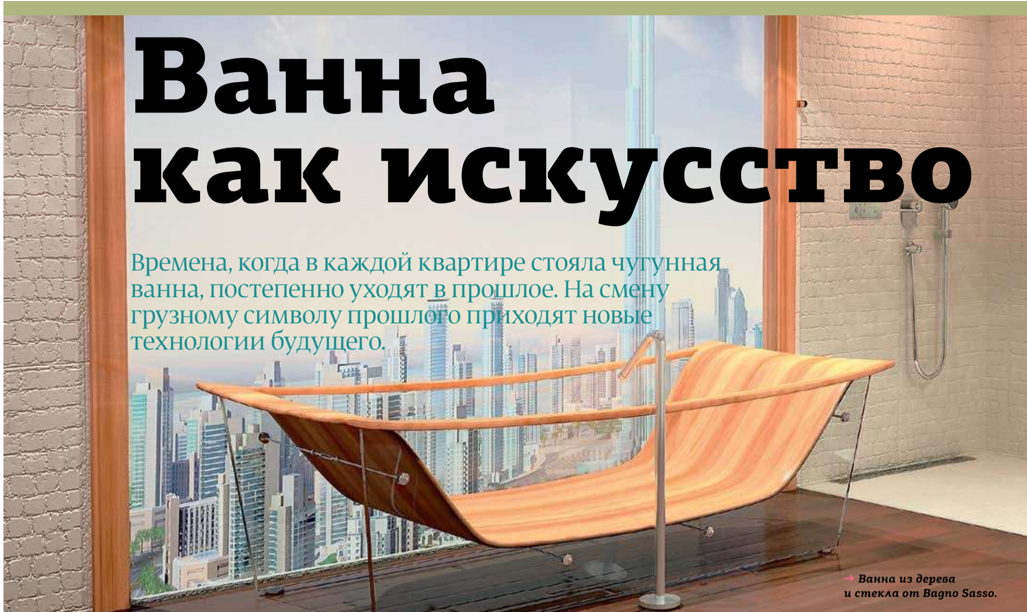
→ Ванна из дерева и стекла от Bagno Sasso.

Времена, когда в каждой квартире стояла чугунная ванна, постепенно уходят в прошлое. На смену грузному символу прошлого приходят новые технологии будущего.