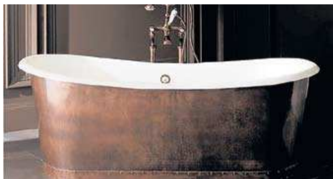
→ Полностью медные ванны встречаются редко, гораздо чаще металл используется в качестве облицовки.