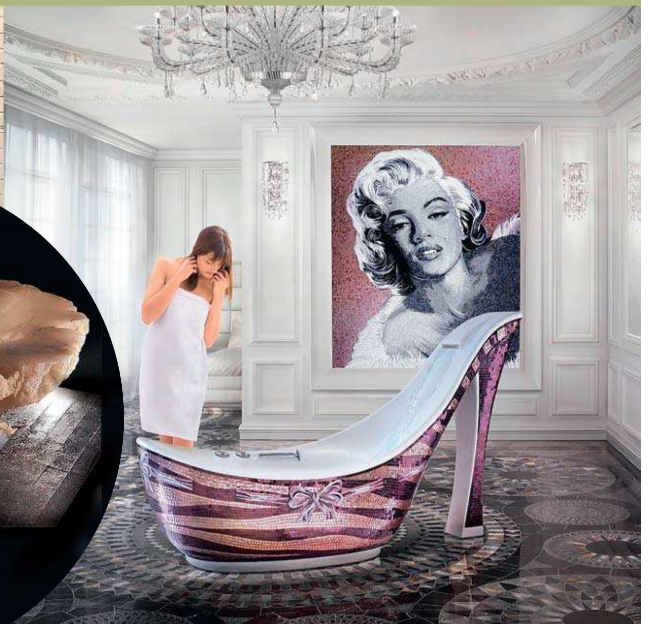
↑ Sicis Audrey — гигантская туфля, покрытая итальянской мозаикой.