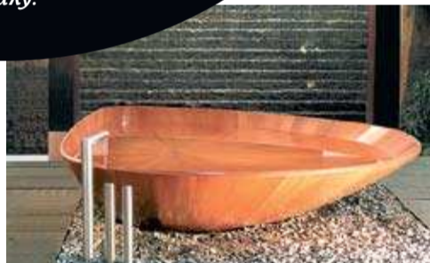
→ Дерево — редкий гость в ваннных комнатах, но эти купальные чаши будут там как нельзя кстати.