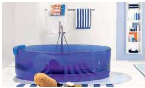
→ Ванна из полиэтилена от Sophia Industrie со встроенной подсветкой и прозрачный мини-бассейн Jolie Regia из полиэфирной смолы с цветными пигментами.